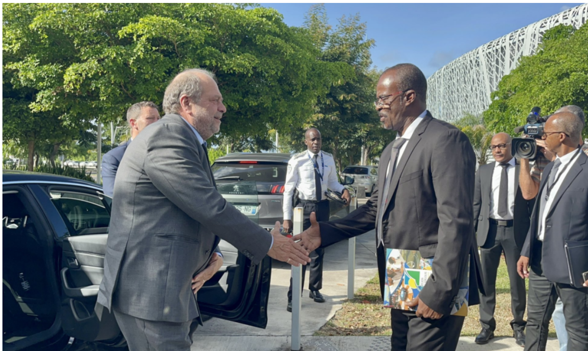
En mai 2023, Ary Chalus président du conseil d'administration accueille au Mémorial acte le garde des Sceaux Éric Dupond-Moretti.