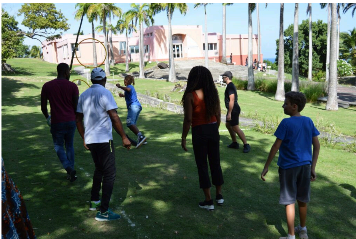
Les élèves de l'école Graines de génie de Petit-Bourg en visite au Musée Edgar Clerc au Moule se sont initiés au jeu du batey ce 22 novembre.