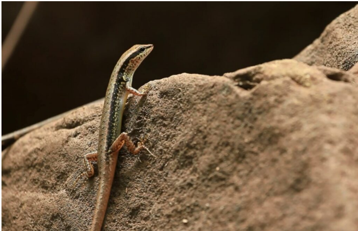
Le scinque, petit lézard endémique à Petite-Terre