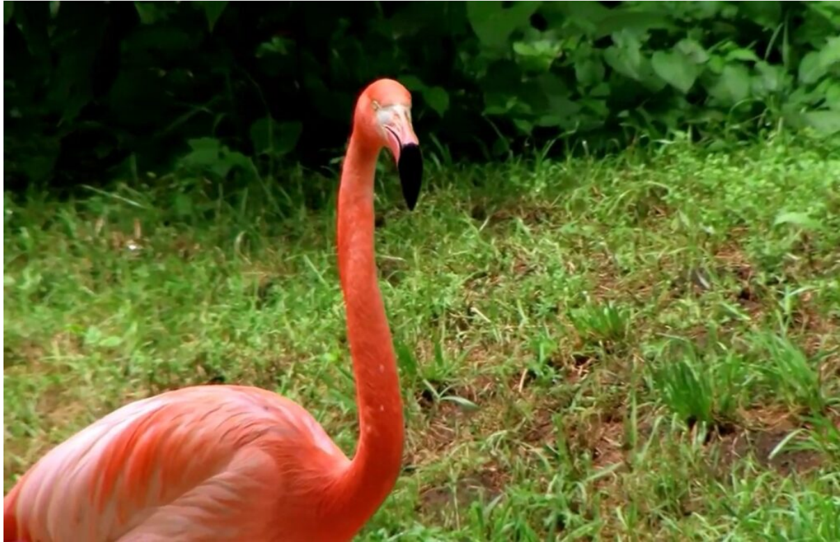
Flamand des Caraïbes.

nichent des espèces d'oiseaux rares, éveille en lui un amour pour l'archipel et marque le début de son engagement. « C'est là que j'ai ressenti l'urgence de protéger ce territoire fragile » raconte-t-il. Depuis, il n'a eu de cesse de développer des projets de conservation à Saint-François, puis à l'échelle régionale.